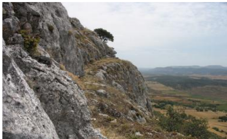
Repisa amplia antes del comienzo de las dificultades